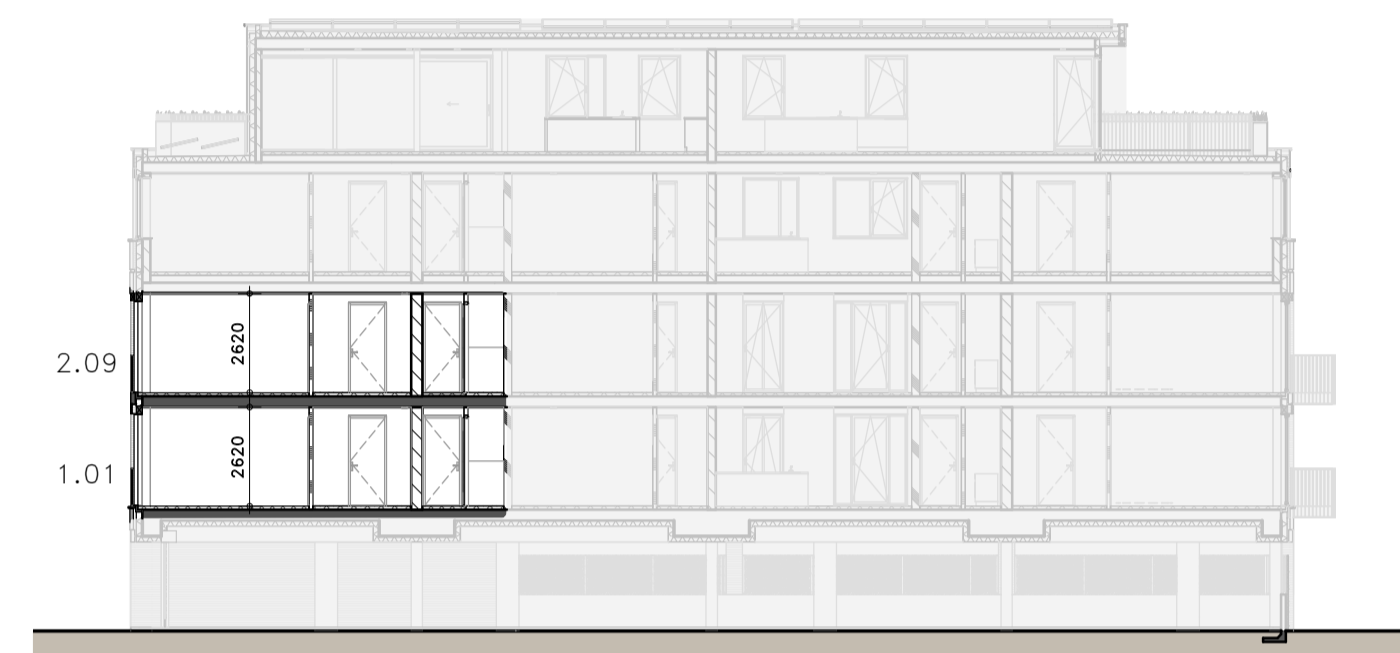
DOORSNEDE schaal 1:200