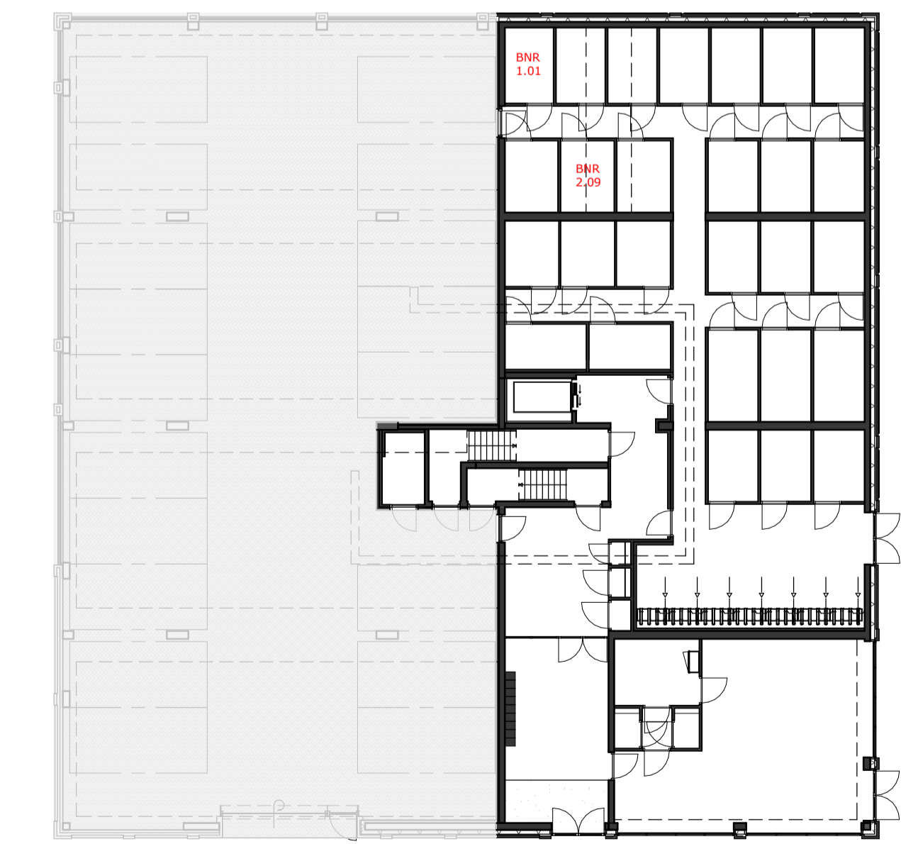
BEGANE GROND schaal 1:200