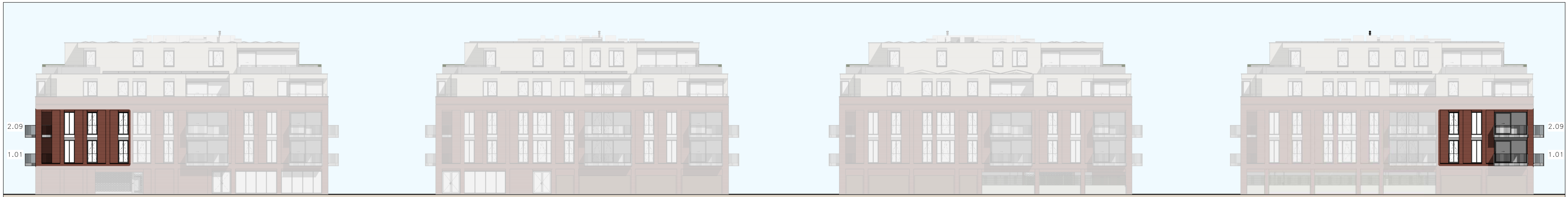
VOORGEVEL schaal 1:200