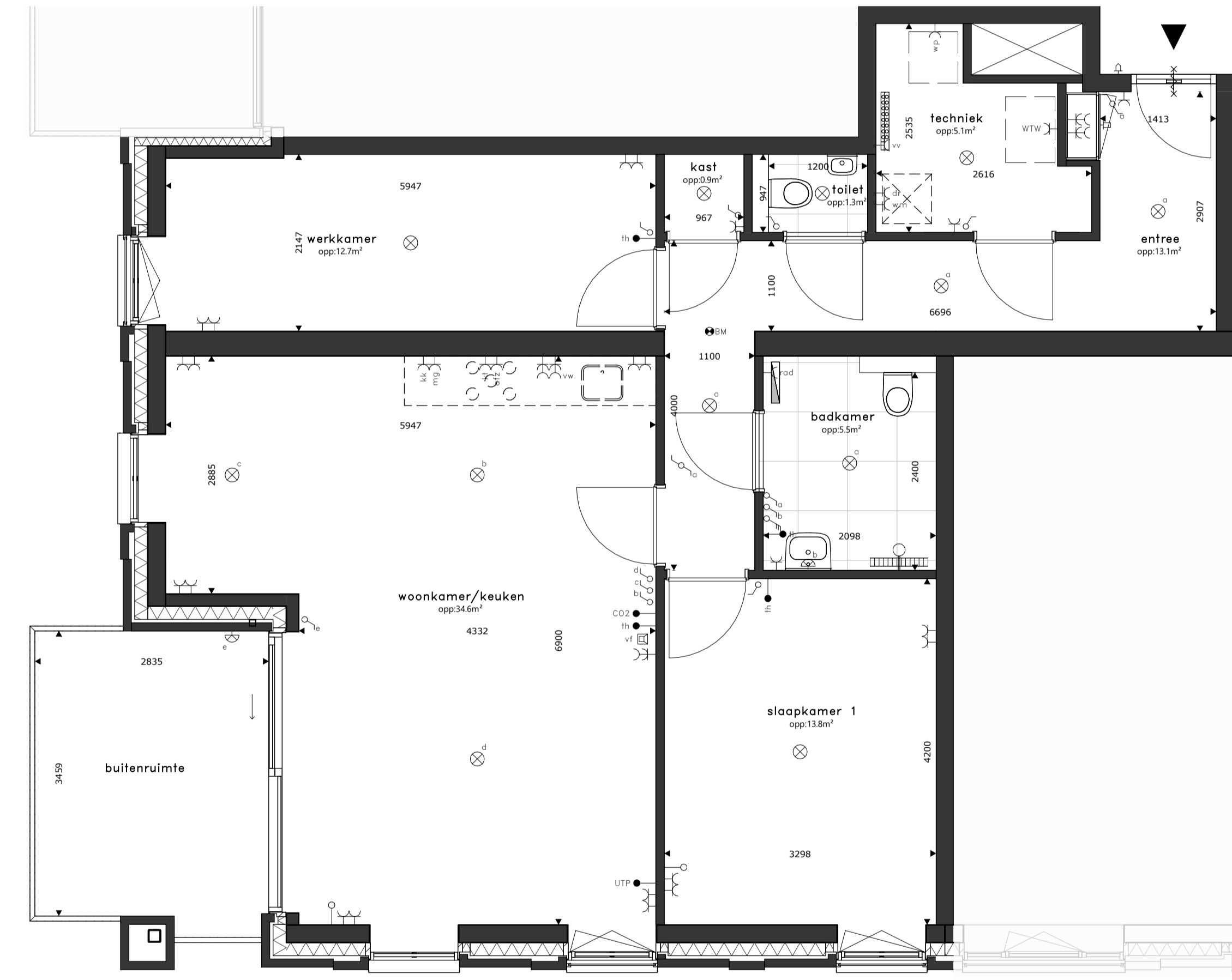
VK.A.01 _verdieping 1 en 2 schaal 1:50